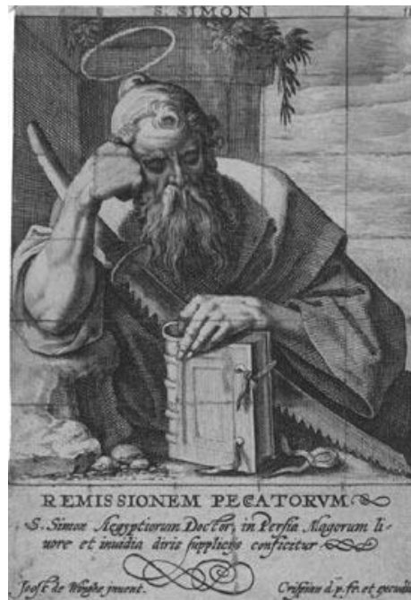
Crispin De Passe il vecchio, San Simone, bulino, foglio smarginato, mm 142×97, inv. PN 9618

Gli apostoli sono quasi sempre raffigurati con i loro attributi tipici, che per la maggioranza di essi sono relativi al martirio subito. [44] Si differenzia in parte la serie di Bara. Mentre nel frontespizio [45] il martirio è raffigurato in piccoli riquadri sui bordi, nelle singole stampe gli apostoli sono collocati all’interno di un paesaggio più ricco e viene evidenziato l’aspetto “itinerante” della predicazione evangelica, oltre al legame con il “libro”. [46] Quest’ultimo tema si trova anche in tutte le stampe di Goltzius, in cui i Dodici sono in atteggiamento di meditazione o preghiera.