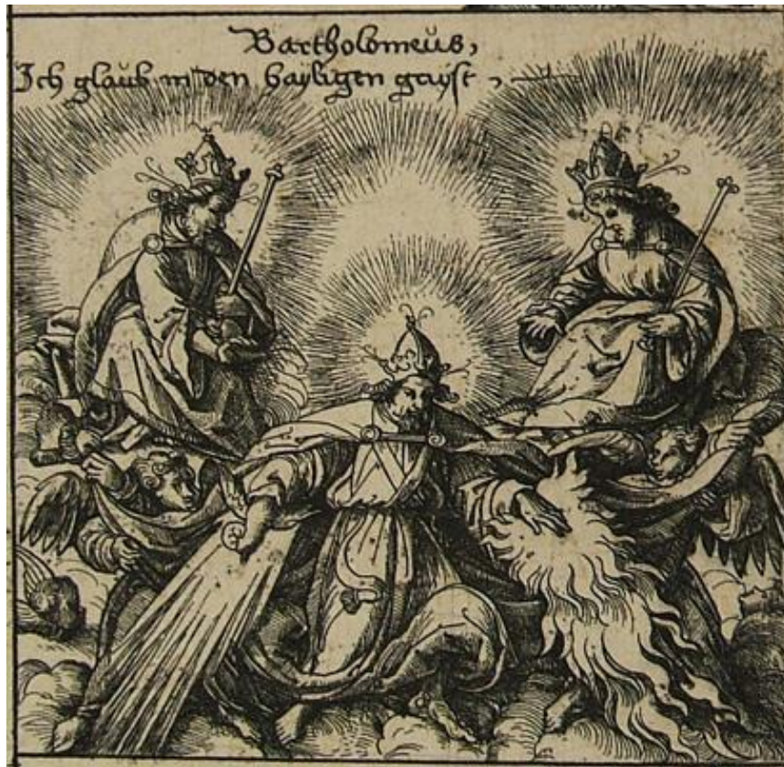
Daniel Hopfer, Il Credo , 8° articolo ( Lo Spirito Santo ), acquaforte, foglio smarginato, mm. 314×443, inv. PN 8109

La terza parte del Credo si apre con la professione di fede nello Spirito Santo (8° articolo, abbinato a Bartolomeo); l'autore rende la “discesa” dello Spirito Santo in modo analogo a quanto visto per la “discesa” del Figlio. Qui si tratta di un personaggio coronato, che tiene nella mano destra una colomba irraggiante luce e nella sinistra il fuoco; è collocato al centro e in basso nella scena, in mezzo ad angeli. Si tratta di un'insolita rappresentazione della Pentecoste, che sorprendentemente esclude la Vergine e gli Apostoli, ma che è comprensibile se collocata nel contesto teologico della Riforma luterana.