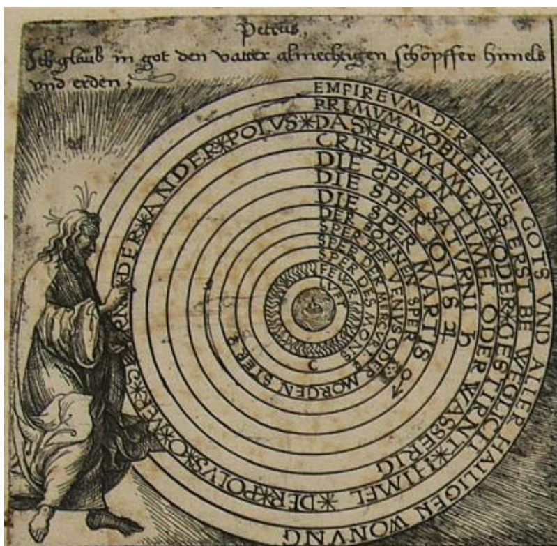
Daniel Hopper, Il Credo , 1° articolo ( La Creazione ), acquaforte, foglio smarginato, mm. 314×443, inv. PN 8109

Vista nel complesso, la stampa si può riallacciare alla catechesi luterana anche nell'impostazione delle immagini: la divisione su tre registri richiama anche al primo colpo d'occhio l'idea della Trinità che tanto era cara in ambito protestante, motivo che ricorre poi nelle singole scene sotto forme analoghe ma volta per volta differenziate.