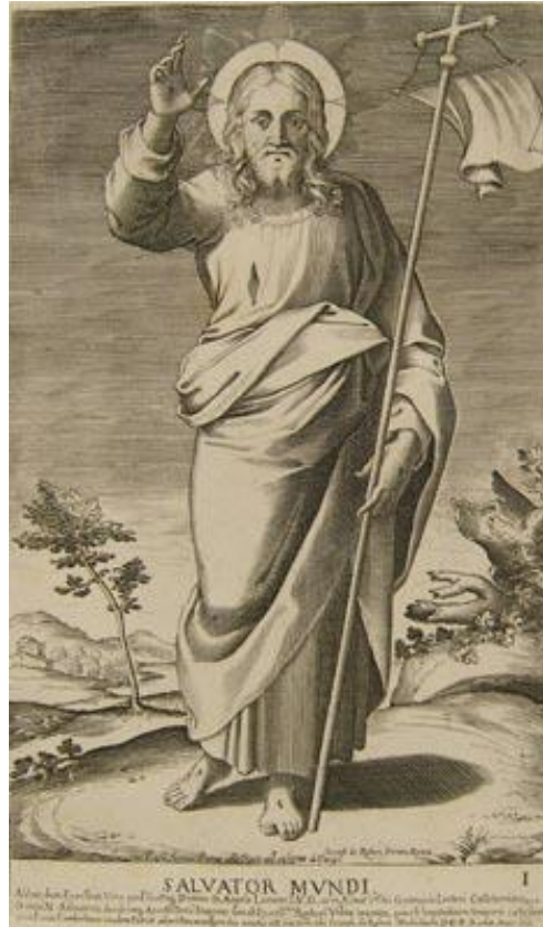
Luca Ciamberlano, San Paolo (dalla serie: Cristo e gli Apostoli), acquaforte, mm. 423×29, inv. 31227

Non è dato sapere se si tratti di una raffigurazione singola o se facesse parte di una serie, ma occorre fare una precisazione di possibile interesse. Nel primo Rinascimento[55] si inizia a diffondere un' iconografia analoga alla presente che raffigura apostoli e santi seduti in trono a fianco di Cristo Giudice, come se partecipassero in un qualche modo a questa sua attività. La stampa – in questo caso sciolta – potrebbe quindi aver fatto in origine parte di una serie di soggetto simile. L' Apostolo Giovanni è spesso raffigurato seduto in trono nell'atto di scrivere in quanto evangelista; nella stampa il santo viene infatti raffigurato con la penna nella mano destra secondo la sua tradizionale iconografia[56] e seduto in trono, in accordo con un' impostazione piuttosto diffusa in ambito ferrarese.