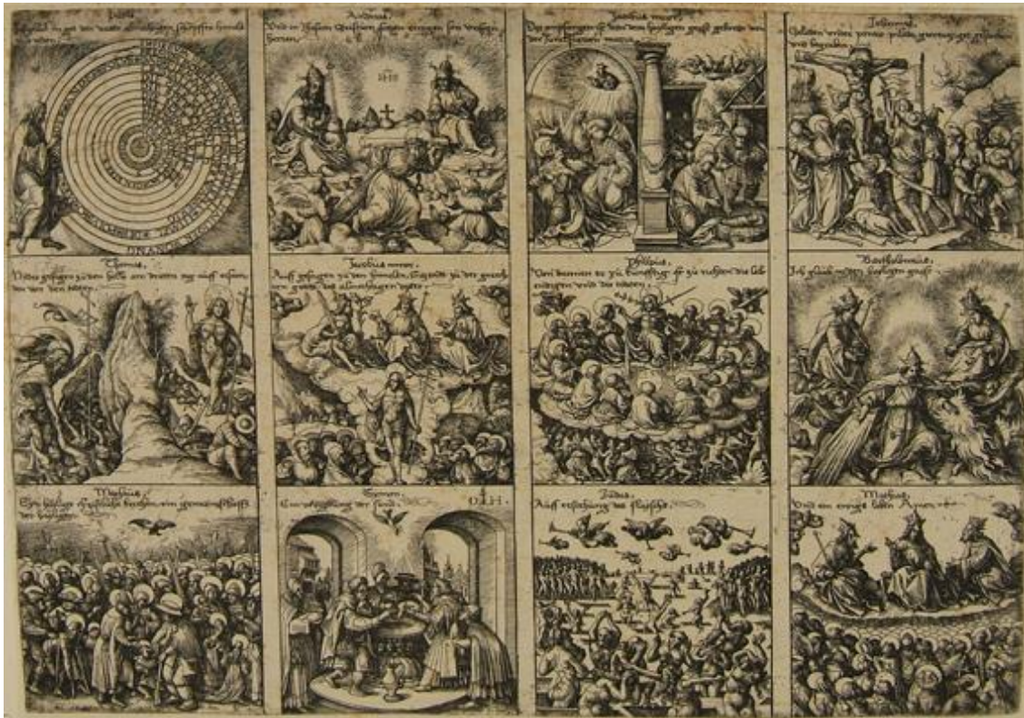
Daniel Hopfer, Il Credo , acquaforte, foglio smarginato, mm. 314×443, inv. PN 8109

L'esemplare (PN 8109) si colloca agli inizi della Riforma luterana[57] e nell'ambito della raffigurazione “scenica” del Credo ; ciascuno degli articoli del “Simbolo apostolico” è narrato attraverso piccole scene che vogliono renderne il contenuto teologico-dottrinale in modo accessibile.