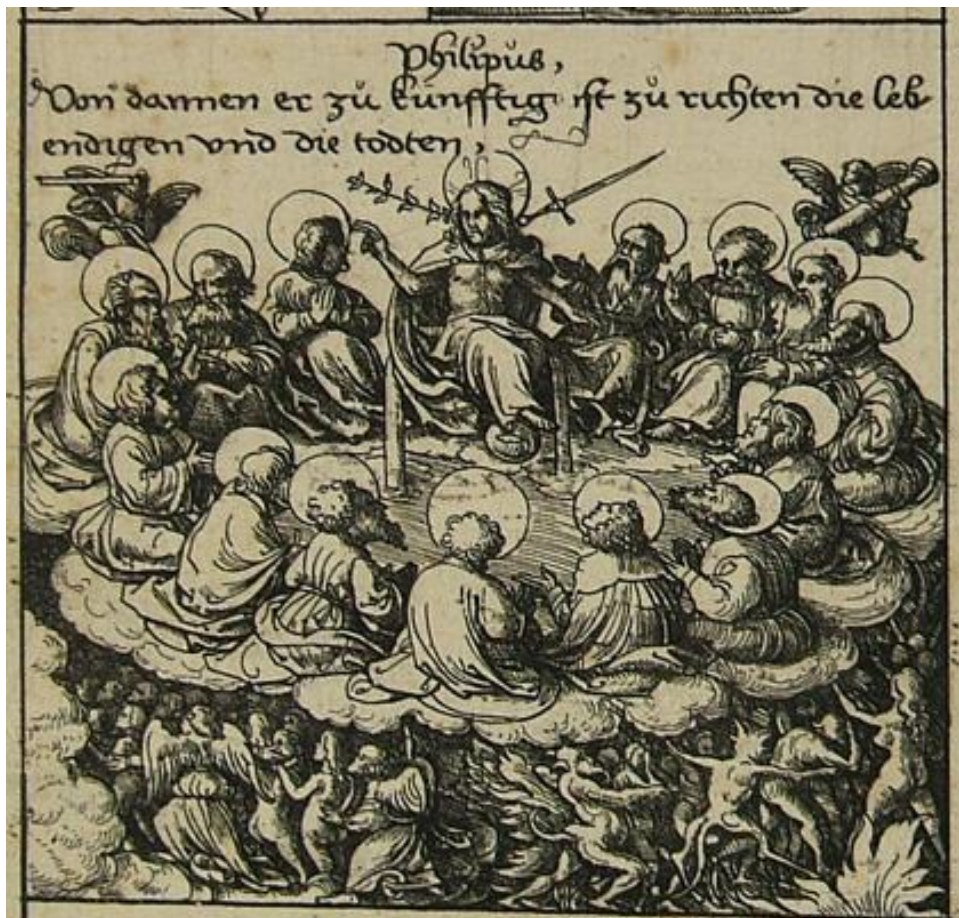
Daniel Hopfer, Il Credo, 7° articolo (Il Giudizio universale) , acquaforte, foglio smarginato, mm. 314×443, inv. PN 8109 © Bologna, Pinacoteca Nazionale, Gabinetto Disegni e Stampe

Il Cristo, di nuovo con la spada[65] e il giglio,[66] si trova in una sorta di “cielo di nuvole” a forma di cerchio, circondato da 14 personaggi. In questo caso si può richiamare quanto detto sulla stampa realizzata dall’anonimo del sec. XV (PN 25188), ampliando il discorso dal solo evangelista Giovanni ad un più nutrito gruppo di personaggi. Cristo Giudice è infatti anche qui affiancato da Apostoli e Santi che, seduti al suo fianco, sembrano interagire fra loro come stessero prendendo importanti decisioni. Al di sotto si trovano i giusti e i dannati, radunati gli uni da angeli e gli altri da demoni.