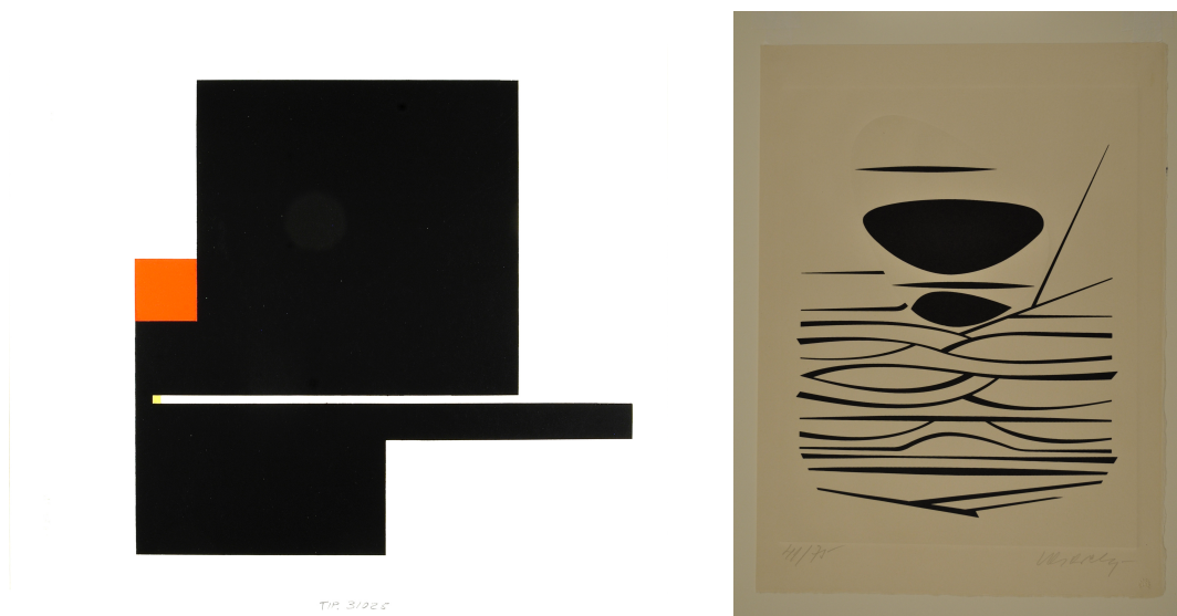
Figura 3: Bruno Munari, Composizione astratta , 1955 Tip. 31025

Il 1955 è un anno fondamentale per la definizione dell'Arte cinetica. Si tiene infatti a Parigi, presso la galleria Denise René, la mostra Il movimento , nell'ambito della quale si distingue il contributo di Victor Vasarely (1906 – 1997) 9 e si delineano le principali direttrici del cinetismo. Il movimento illusorio provocato dalla semplice attivazione ottica di una superficie e la modificazione repentina di un'opera in relazione allo spostamento del fruitore sono peculiarità del lavoro di Vasarely. Caratteristiche che contraddistinguono anche i due lavori appartenenti alla Collezione Tabarroni, anzi, a voler essere precisi, i due fogli esemplificano ognuno una delle metodiche enunciate. La serigrafia Composizione con cerchi e quadrati o Betelgeuse (1959 Tip. 30756), dal nome della seconda stella più luminosa della costellazione di Orione, presenta una continua inversione del rapporto figura/sfondo; tecnica che induce nello spettatore una ipnotica illusione di movimento e di volume. In Composizione astratta (Morphemes) del 1966 (fig. 4, Tip. 30757) 10 invece il rilievo calcografico dell'acquaforte genera un impaccio percettivo nel fruitore che non riesce a risolversi circa la natura illusoria o fisica della modificazione di ciò che guarda.